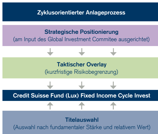
Abbildung 2: Der Anlageprozess

Zusätzlich geben die klaren und ausdrücklichen Anlagerichtlinien dem Portfoliomanager ein Gerüst an die Hand. Detaillierte Portfolio-, Rendite- und Risikoberichte sorgen für vorbildliche Transparenz.