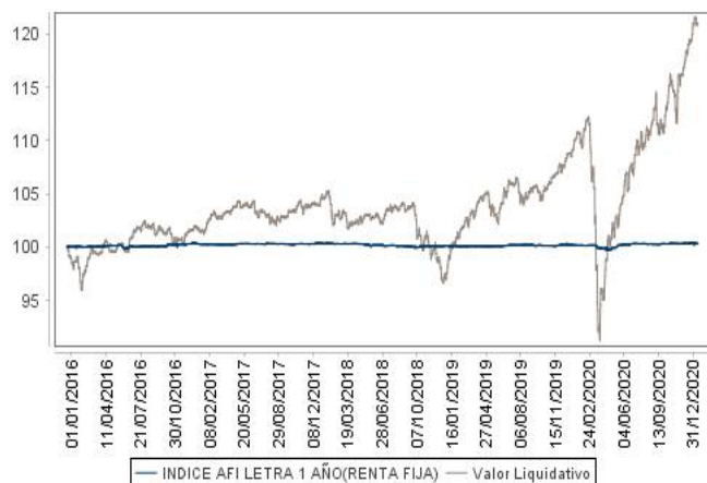
Evolución del valor liquidativo últimos 5 años