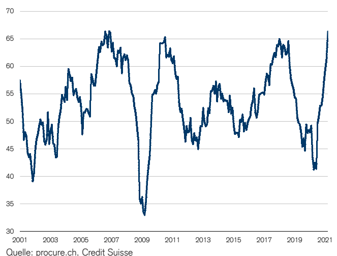
Abb. 1: Industrie-PMI nahe Rekordhoch Wachstumsschwelle = 50

Wichtige Informationen: Dieser Bericht bildet die Ansicht des CS Investment Strategy Departments ab und wurde nicht gemäss den rechtlichen Vorgaben erstellt, welche die Unabhängigkeit der Investment-Analyse fördern sollen. Er ist kein Produkt des Credit Suisse Research Departments, auch wenn er sich auf veröffentlichte Research-Empfehlungen bezieht. Die CS verfügt über Weisungen zum Umgang mit Interessenkonflikten einschliesslich solcher, die den Handel vor der Veröffentlichung von Investment-Analysedaten betreffen. Diese Weisungen finden auf die in diesem Bericht enthaltenen Ansichten der Anlagestrategen keine Anwendung.