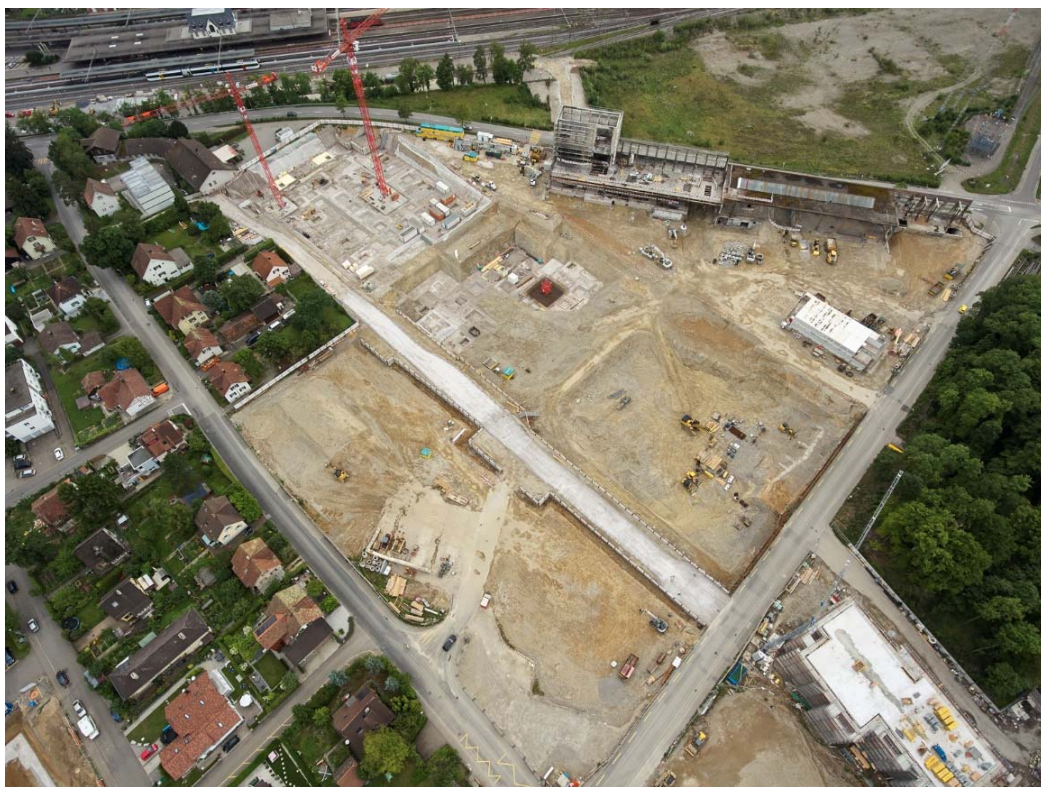
Das Bülachguss-Areal umfasst acht Baubereiche

Per 1. September 2017 hat Allreal mit dem Verkauf der insgesamt 73 Eigentumswohnungen begonnen. Die Vermarktung der Mietwohnungen der Baubereiche 2, 5 und 6 der Immobilienfonds CS REF Green Property und CS REF Siat startet voraussichtlich im Frühling 2018.