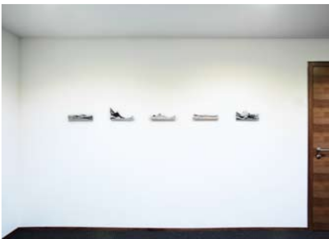
Rücken | Ridges, 2006–2008