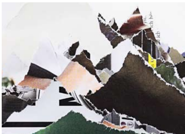
Nahansicht eines Rückens | Close-up view of Ridges

Credit Suisse AG Zürich-Enge, Bleicherweg 33