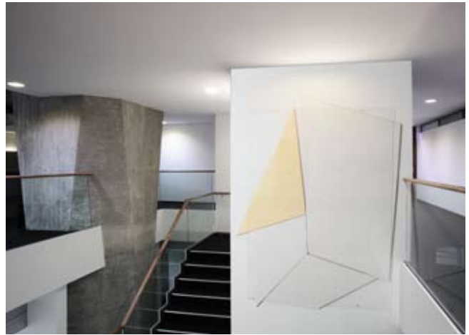
Ohne Titel (weisse Bilder) | Untitled (white images), 2009

Holz, Glas, Acryl, Klebeband, PVC-Reissverschluss, Perlenkette