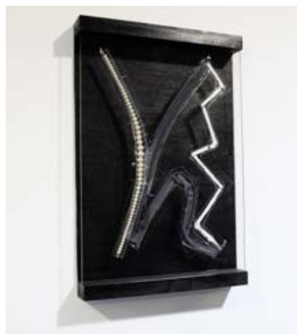
Ohne Titel | Untitled, 2008

Edit Oderbolz's works play with a sort of travesty of physical materials. At first glance, things appear to be what they are not. The relief Untitled (white images) in the stairwell of the Credit Suisse AG Zurich-Enge branch is made from pieces of coated chipboard, roughly cut up with a handsaw. Together they form an irregular, trapezoidal mosaic, each piece slightly askew with respect to the others. Protected by an acrylic glass panel, the waste material bears a resemblance to works by American color field painters – more raw perhaps, but just as aesthetic. Oderbolz, in addition to this performance with material misrepresentation, also engages with the aura of the artwork. The cheap industrial product in the relief has acquired a singularity and a beauty that draw our attention to the fine line between the aesthetic and the banal. Oderbolz's work ennobles the material, at the same time rendering it newly visible.