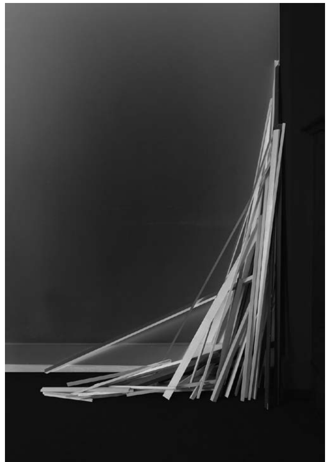
Repose | 2015, Inkjet Print auf Papier | Inkjet print on paper, 98 × 65.5 cm